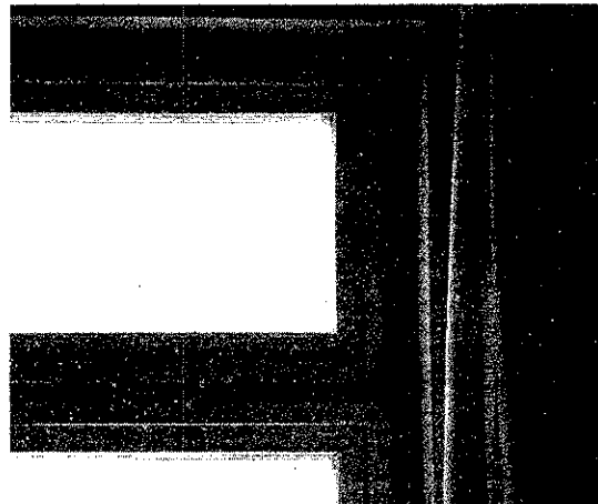
INVESTICIJOS: Buvusios klinikos pastate – vėjo prapučiama langai, kai kur suskilinėjusios sienos, pro stogą vietomis bėga vanduo. Kiek reikės investicijų, dar neskačiuojama.

Kol čia veiks ligoninė, nuolat buvo skundžiamasi, kad pastatas vėjų prapučiama. Šiauliams šią ligoninę sovietmečiu statant buvo pritaikytas ligoninės, skirtos Vidurinės Azijos respublikoms, tipinis projektas.